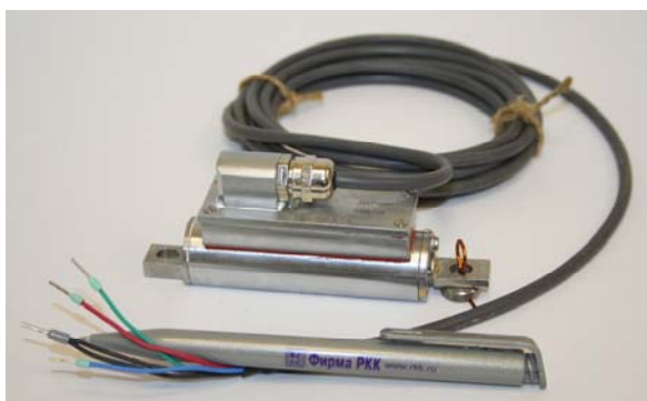
Рис. 4. Внешний вид струнного датчика деформации в водостойком исполнении

а – установленные в двух продольных плоскостях на трубопроводе входа газа УПГТ (в нижней части снимка – ПУС); б – на несущей балке металлоконструкции