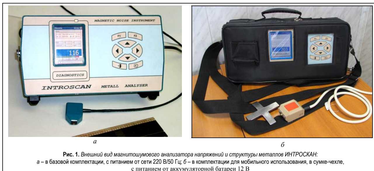
Рис. 1. Внешний вид магнитошумового анализатора напряжений и структуры металлов ИНТРОСКАН: а – в базовой комплектации, с питанием от сети 220 В/50 Гц; б – в комплектации для мобильного использования, в сумке-чехле, с питанием от аккумуляторной батареи 12 В

тичность параметров датчиков, возможность работы в режиме стабилизации магнитного потока (что позволяет существенно снизить влияние подготовки поверхности на результаты измерений), возможность измерения угловой зависимости (круговой диаграммы) ШБ путем вращения вектора магнитного поля возбуждения с помощью 4-полюсного датчика. ИНТРОСКАН имеет встроенный компьютер с цветным ЖК-дисплеем и операционной системой Windows-CE, что обеспечивает широкие возможности при подготовке, проведении и обработке измерений.