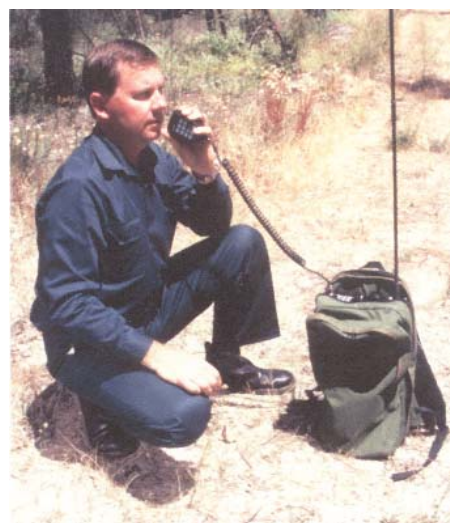
Ранцевая КВ-радиостанция Q-MAC (HF-90)