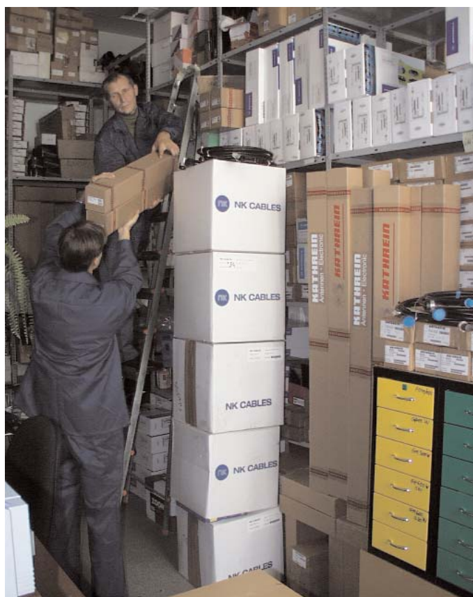
Поставка продукции производится со склада в Москве

И хотя абсолютное большинство требований, предъявляемых заказчиками к системам ПМР, сегодня можно выполнить с применением развитых аналоговых радиосистем, например ACCESSNET, причем стоимость