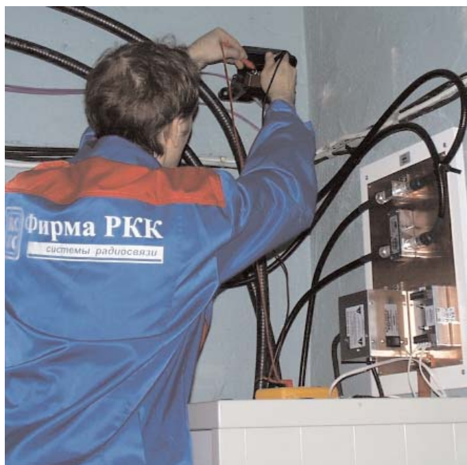
Ввод в коммерческую эксплуатацию транковой системы для УВД Камчатской области

Первые успехи цифровой радиосвязи, в особенности реально работающие за рубежом системы TETRA, также оказали свое влияние на российских заказчиков,