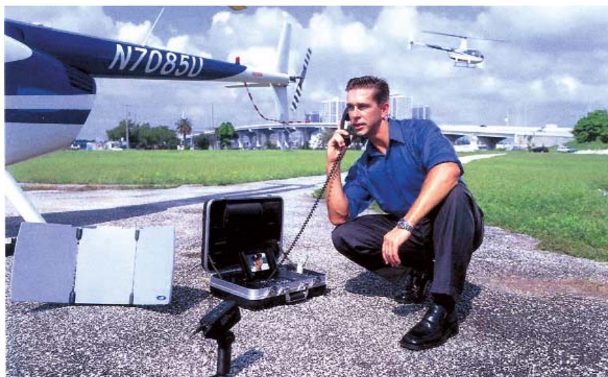
Портативный комплект аппаратуры видеоконференц-связи VOYAGER

ООО "Фирма РКК" прилагает все усилия для того, чтобы по-прежнему быть надежной точкой опоры для своих заказчиков.